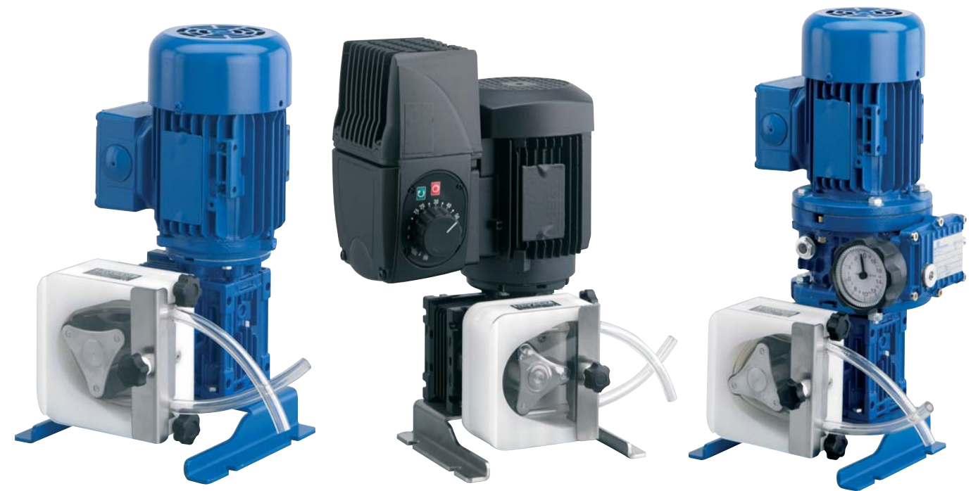
Velocidad fija Fixed speed