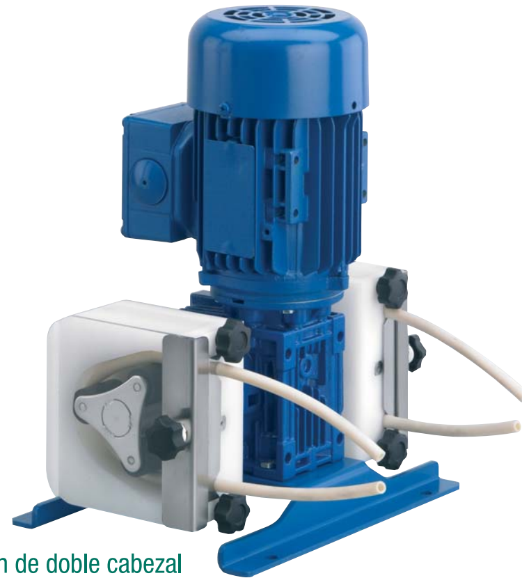
Versión de doble cabezal Double head version