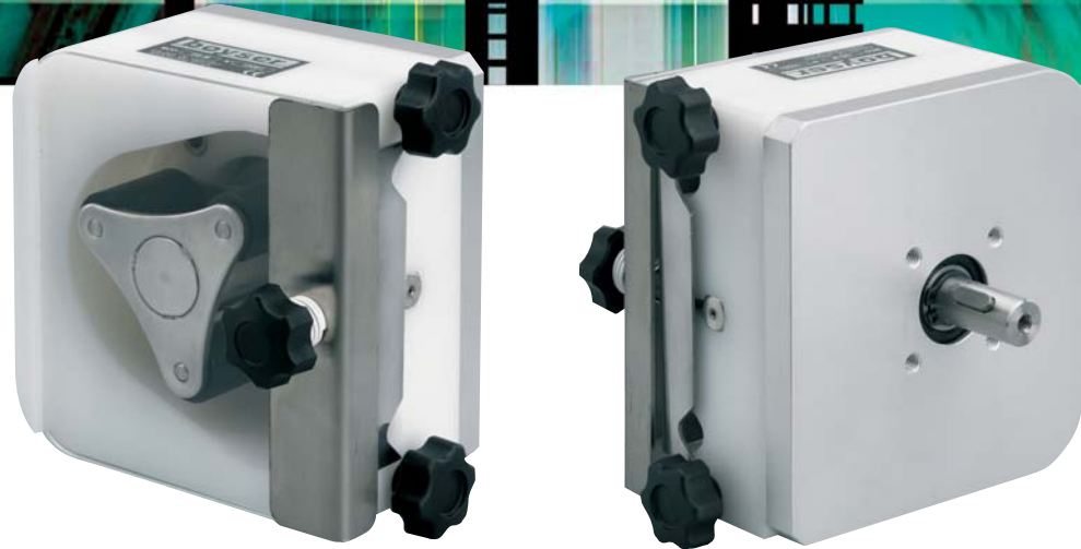
Versión a eje libre O.E.M. Version