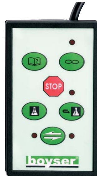
Teclado para dosificación de volúmenes exactos Batch applications keyboard